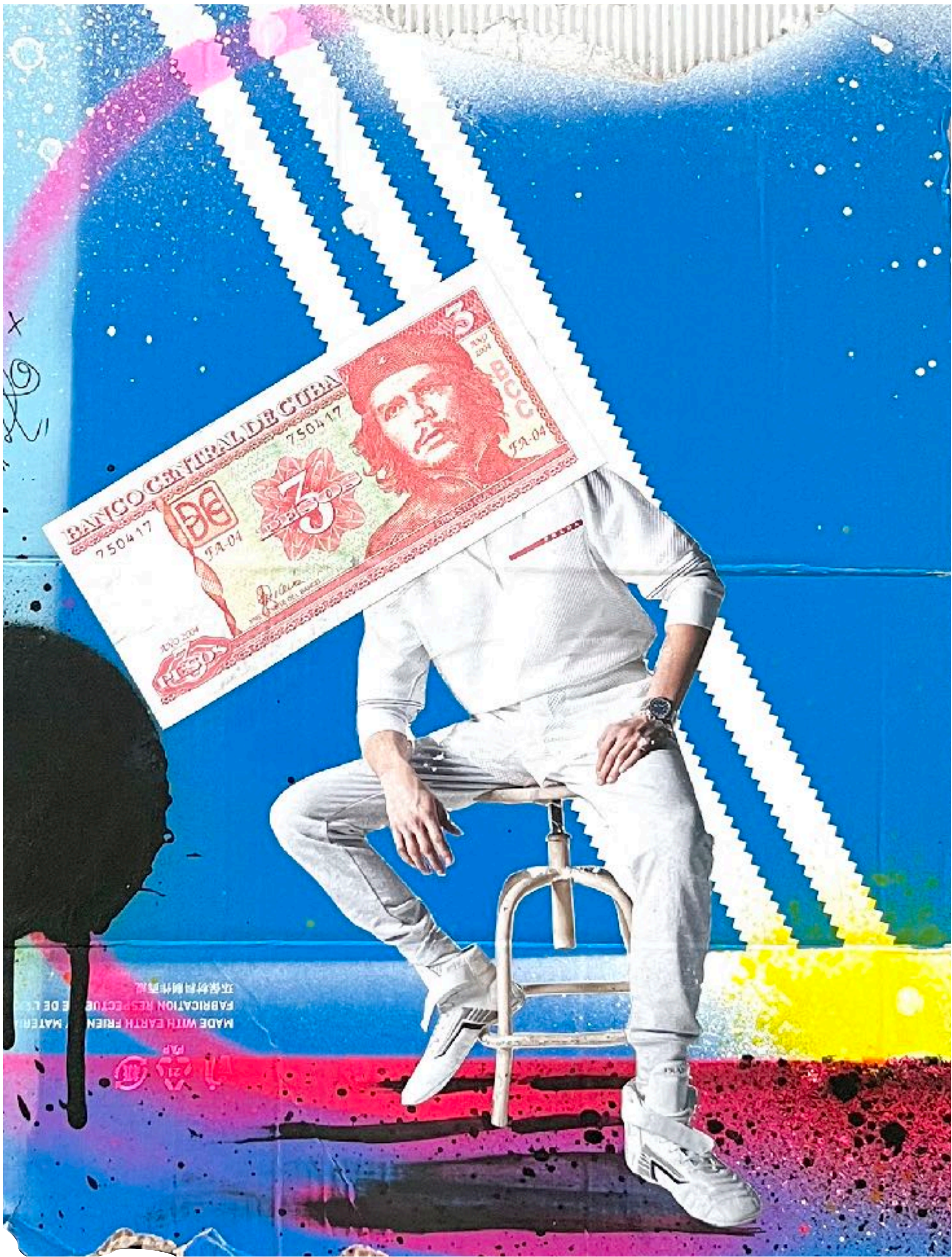
THE POP SURREALIST